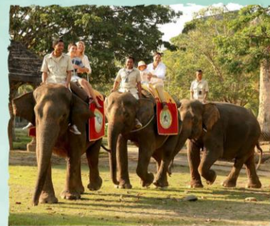
Elephant Back Safari