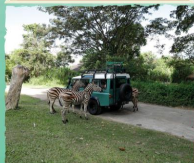
4 X 4 SAFARI