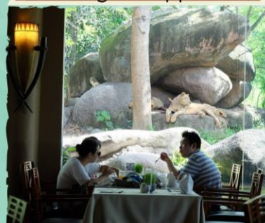
BREAKFAST WITH THE LIONS