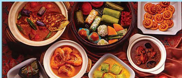
娘惹餐 Nyonya Food

骨肉茶此“茶”非彼“茶”，虽然肉骨茶名为「茶」，是一道猪肉药材汤，汤料却完全没有茶叶的成份，反而是以猪肉和猪骨，混合中药及香料，熬煮多个小时的浓汤。