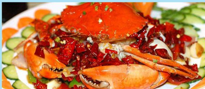
辣椒螃蟹 Chili Crab

娘惹菜由传统中国菜烹饪法与马来香料完美结合，融会了甜酸、辛香、微辣等多种风味，所用的酱料都由起码十种以上香料调配而成。令人交口称赞的南洋最特别、最精致的佳肴之一。