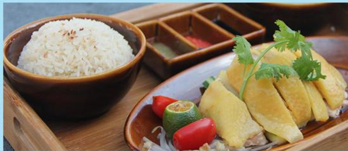
海南鸡饭 Hainanese Chicken Rice