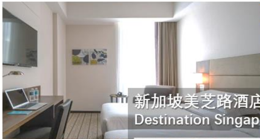
新加坡美芝路酒店 Destination Singapore Beach Road