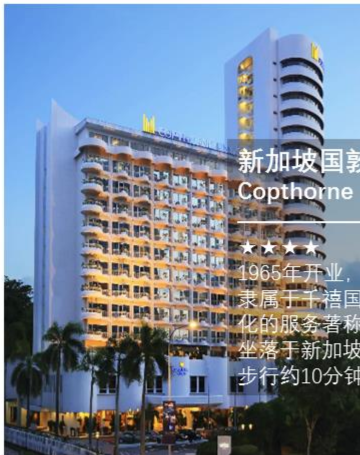
新加坡国敦统一酒店 Copthorne King's Hotel