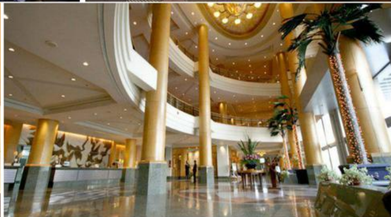
芭提雅海湾海滩度假村