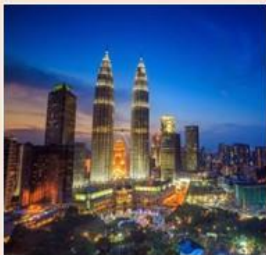
国家石油公司双子塔