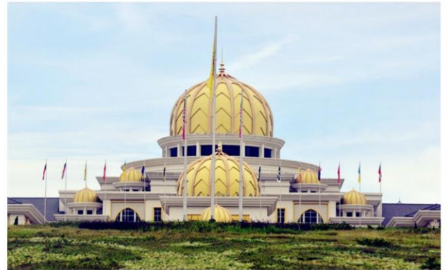
国家皇宫&独立广场