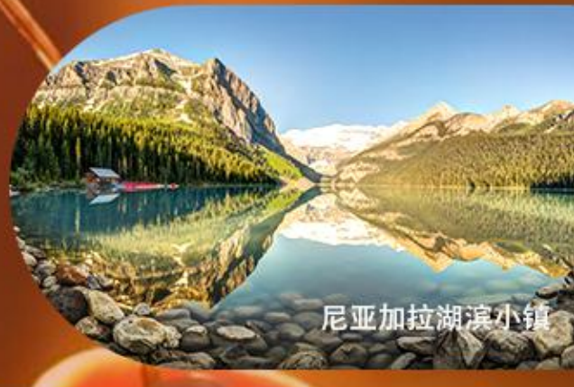
尼亚加拉湖滨小镇