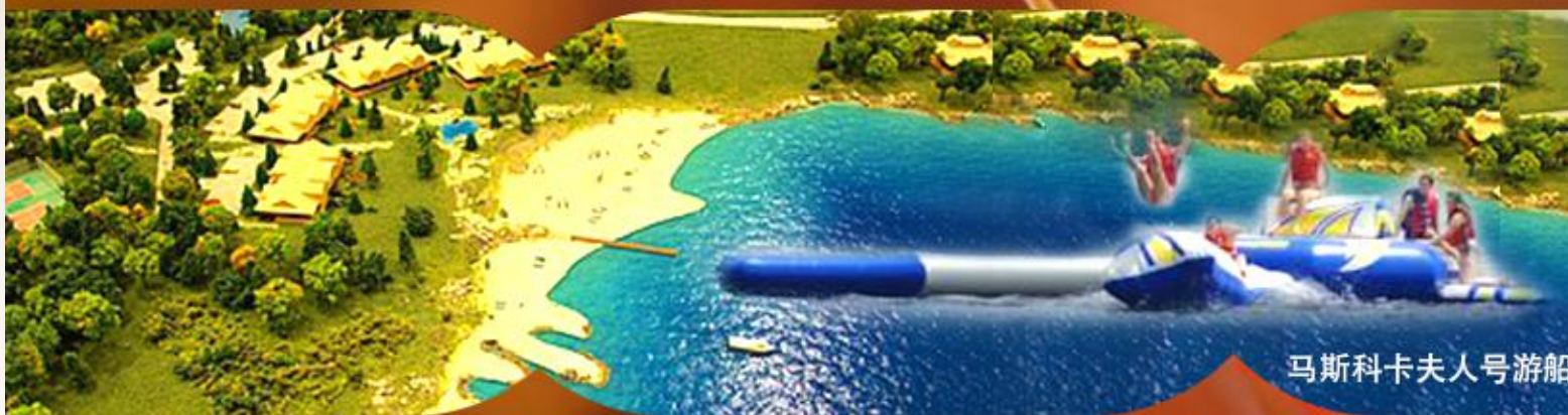
马斯科卡夫人号游船