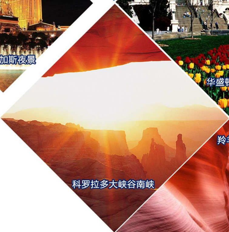
科罗拉多大峡谷南峡