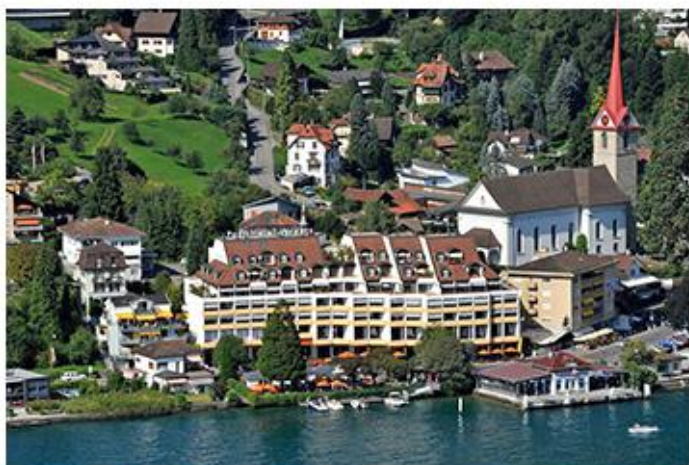
Post Hotel Weggis (韦吉斯波斯特酒店或同级)

酒店位于韦吉斯 (Weggis) 中心，距离卢塞恩湖 (Lake Lucerne) 湖畔仅有一小段步行路程。每间宽敞的客房均配有浴缸、有线电视、阳台以及迷你吧。豪华间享有湖泊和皮拉图斯山 (Pilatus)、瑞吉峰 (Rigi) 和布尔根施托克山 (Bürgenstoc) 美景。