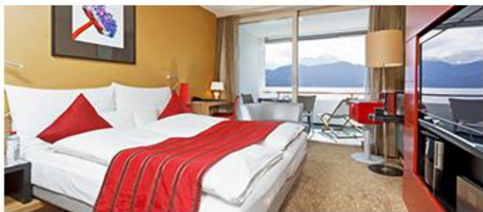
Dorint Airport-Hotel Zürich (多林特机场苏黎世酒店或同级)

酒店位于韦吉斯 (Weggis) 中心，距离卢塞恩湖 (Lake Lucerne) 湖畔仅有一小段步行路程。每间宽敞的客房均配有浴缸、有线电视、阳台以及迷你吧。豪华间享有湖泊和皮拉图斯山 (Pilatus)、瑞吉峰 (Rigi) 和布尔根施托克山 (Bürgenstoc) 美景。