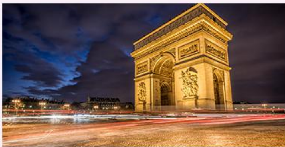
3 古都之浪漫之都 巴黎