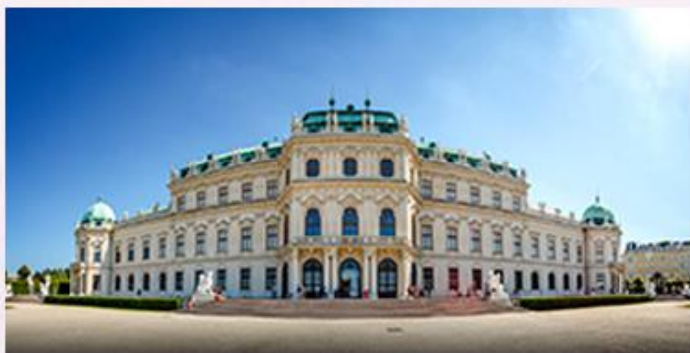
3 古都之音乐之都 维也纳