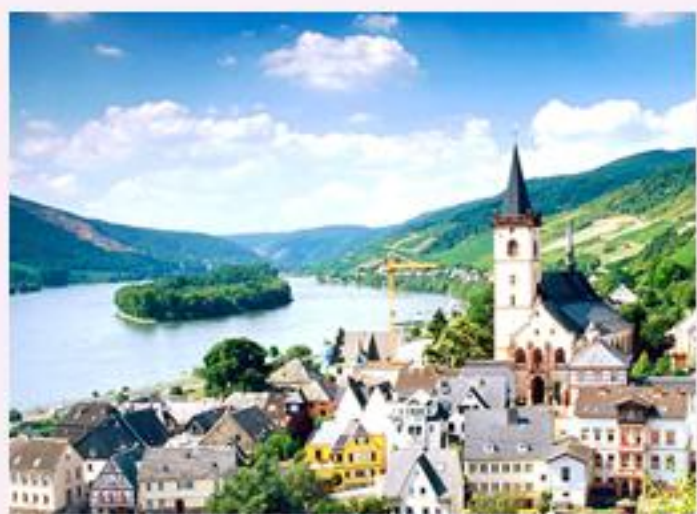
2 大湖之湖光山色 —滴滴湖