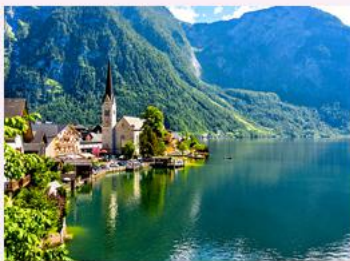
2 大湖之湖光山色 —哈尔施塔德