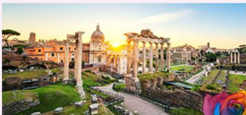
3 古都之艺术之都 罗马