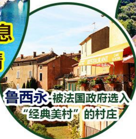
鲁西永 被法国政府选入 “经典美村”的村庄