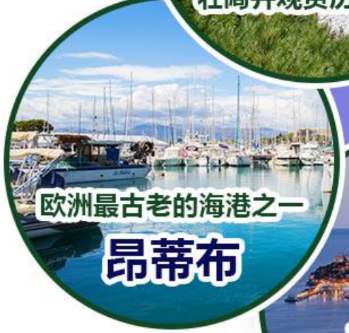
欧洲最古老的海港之一 昂蒂布