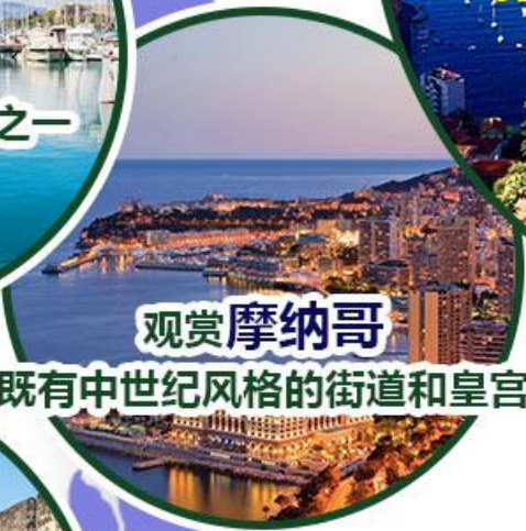
观赏 摩纳哥 既有中世纪风格的街道和皇宫