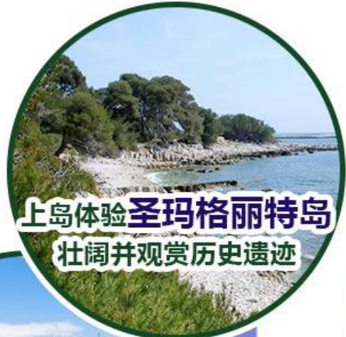
上岛体验 圣玛格丽特岛 壮阔并观赏历史遗迹