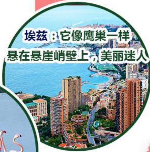
埃兹 ：它像鹰巢一样 悬在悬崖峭壁上，美丽迷人