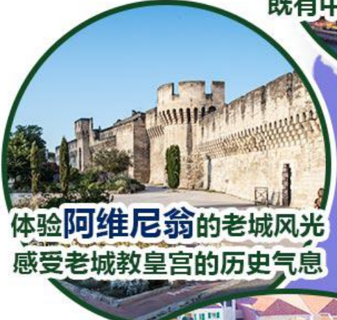
体验 阿维尼翁 的老城风光 感受老城教皇宫的历史气息