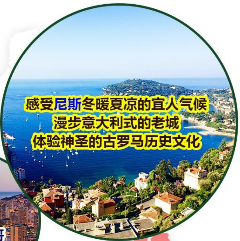
感受 尼斯 冬暖夏凉的宜人气候 漫步意大利式的老城 体验神圣的古罗马历史文化