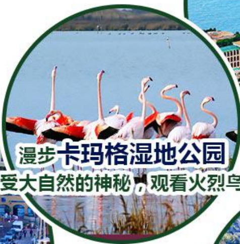
漫步 卡玛格 湿地公园 感受大自然的神秘，观看火烈鸟等