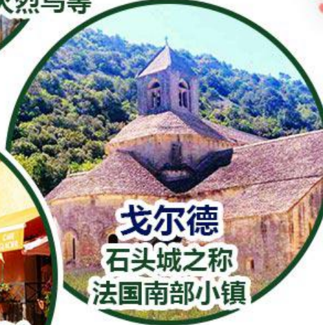
戈尔德 石头城之称 法国南部小镇