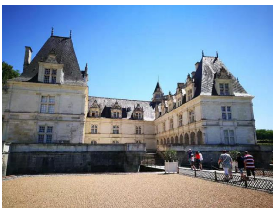
▲ 维朗德里城堡和花园