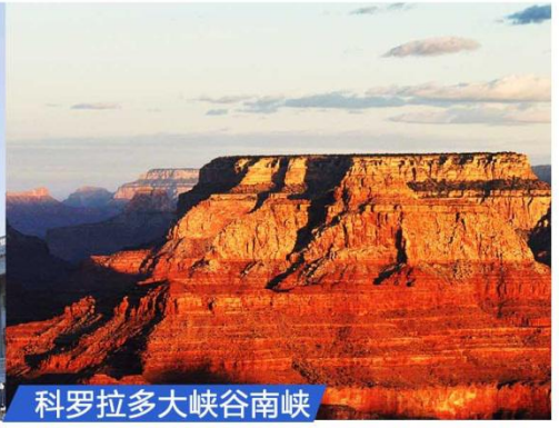
科罗拉多大峡谷南峡