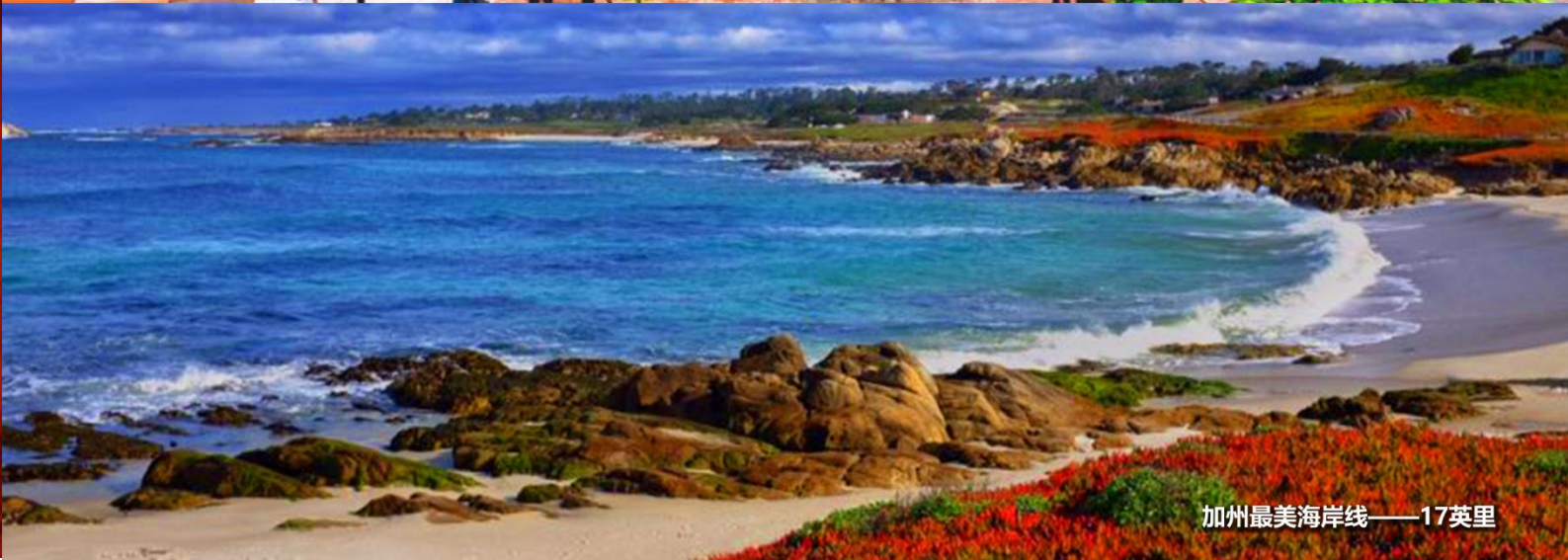
加州最美海岸线——17英里