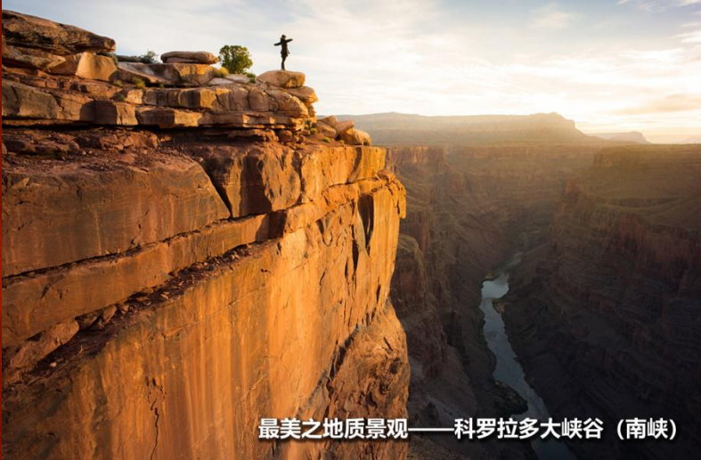
最美之地质景观——科罗拉多大峡谷（南峡）