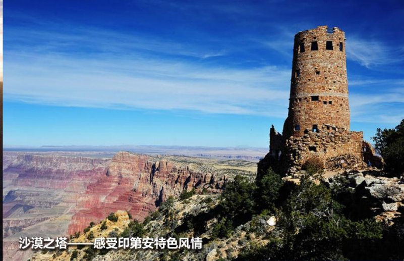
沙漠之塔——感受印第安特色风情