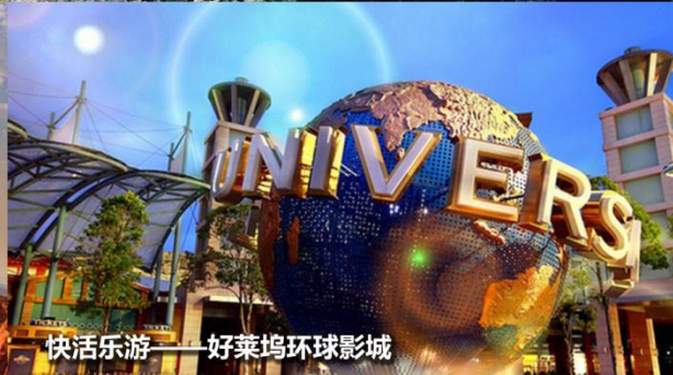
快活乐游——好莱坞环球影城