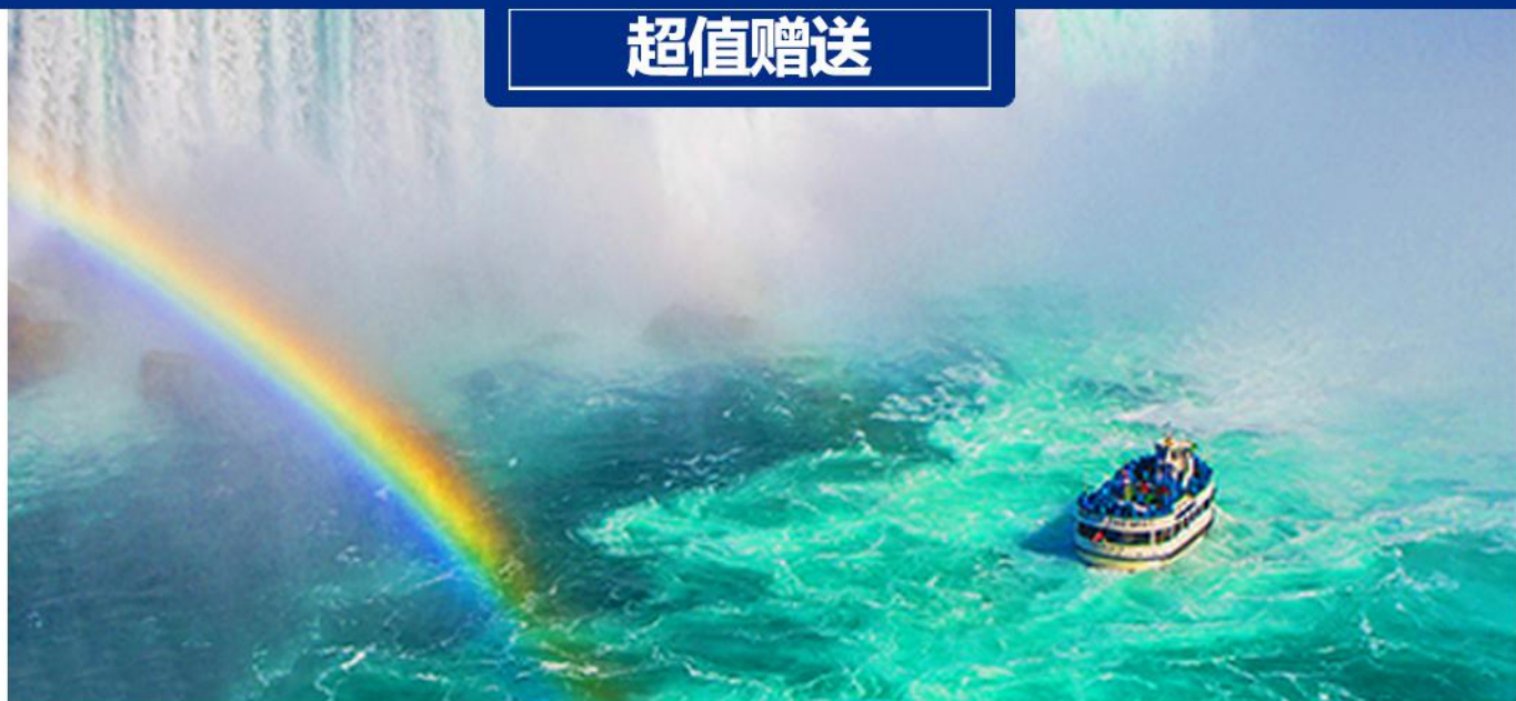
搭乘号角号瀑布景观船畅游-尼亚加加大瀑布