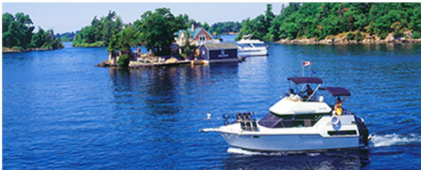
乘坐千岛群岛游船打卡最美圣罗伦斯河