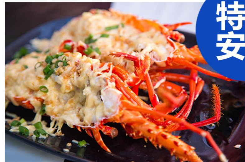
舌尖上的旅行-免费升级一顿“品味龙虾特色餐”