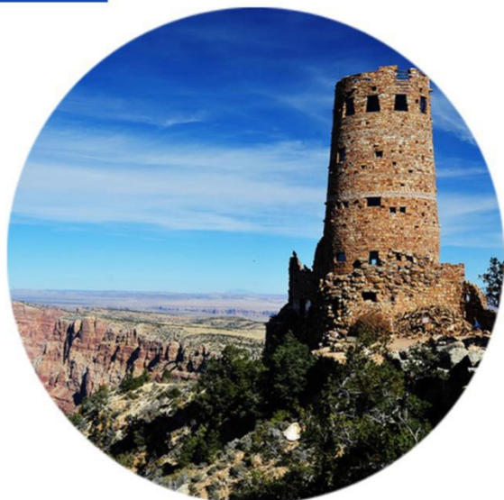
感受印第安特色风情-沙漠之塔