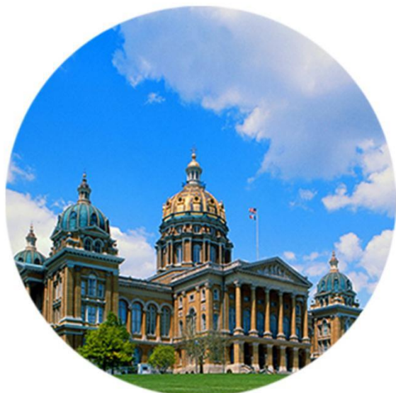
羚羊岛州立公园+盐湖城市内