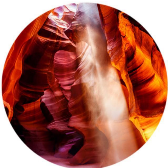
摄影家的天堂-羚羊峡谷/马蹄湾