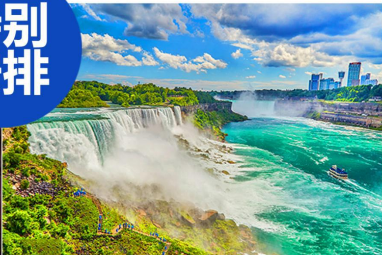
世界最大瀑布-尼亚加拉大瀑布