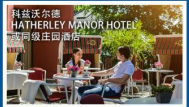
科兹沃尔德 HATHERLEY MANOR HOTEL 或同级庄园酒店