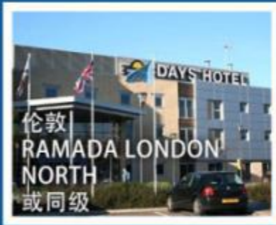
伦敦 RAMADA LONDON NORTH 或同级