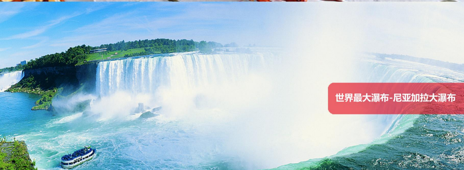
世界最大瀑布-尼亚加拉大瀑布