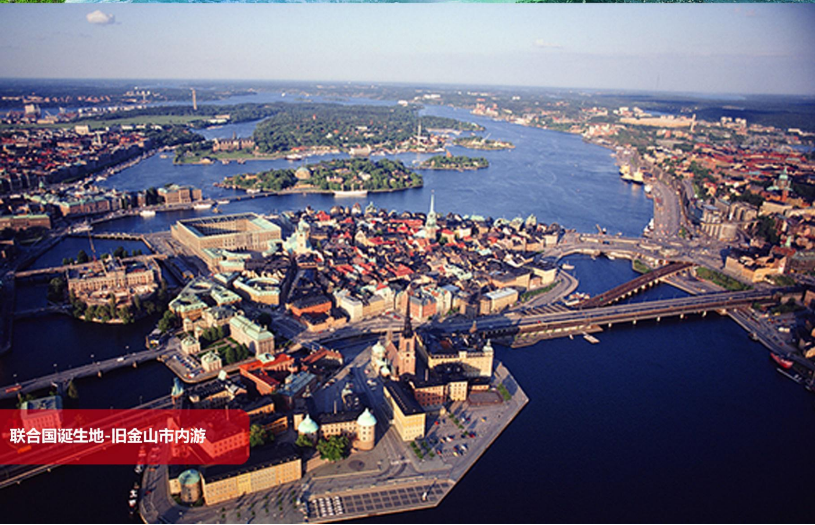
联合国诞生地-旧金山市内游