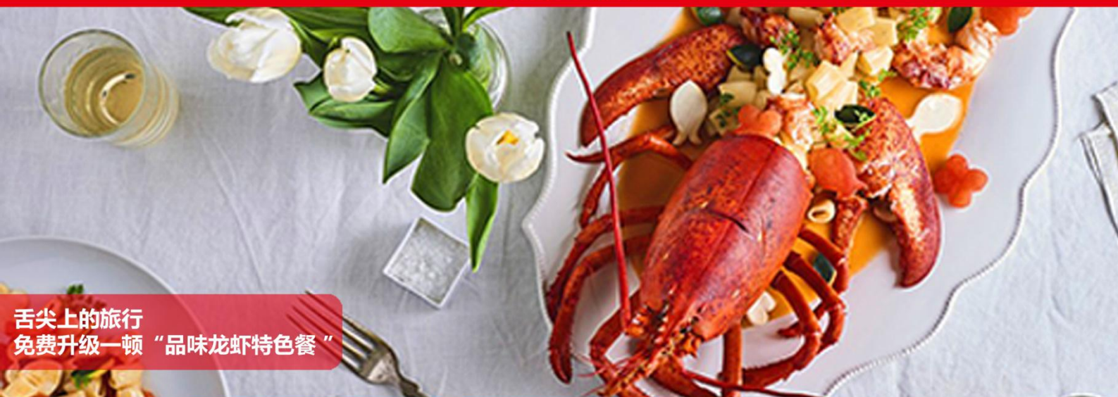
舌尖上的旅行 免费升级一顿“品味龙虾特色餐”