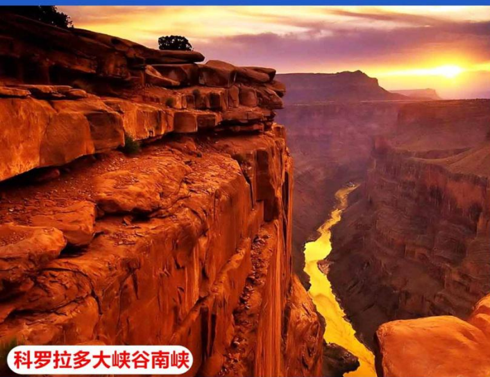
科罗拉多大峡谷南峡