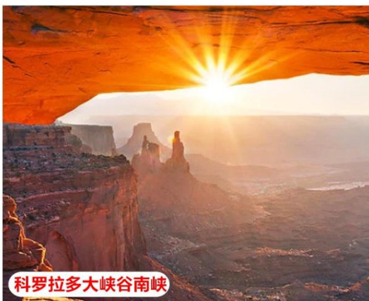
科罗拉多大峡谷南峡