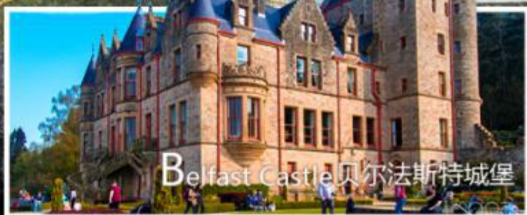
Belfast Castle 贝尔法斯特城堡