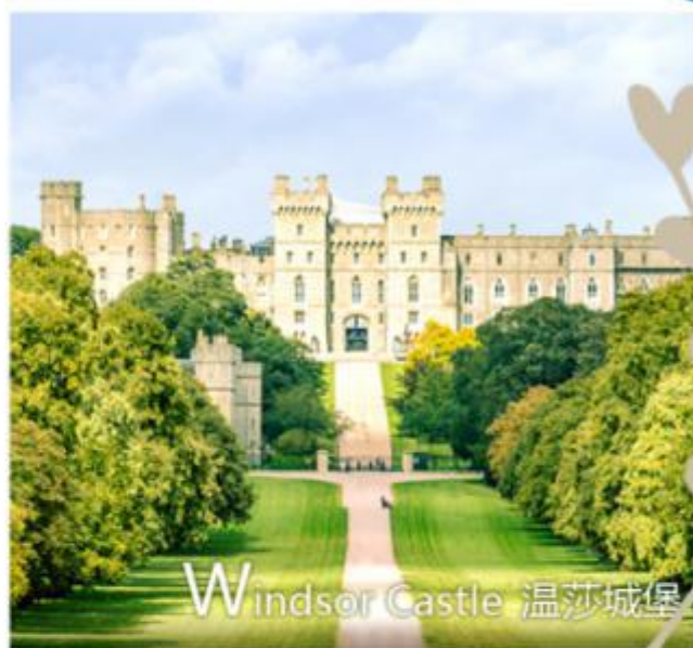
Windsor Castle 温莎城堡