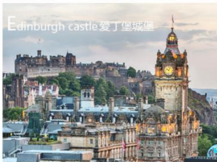
Edinburgh castle 爱丁堡城堡