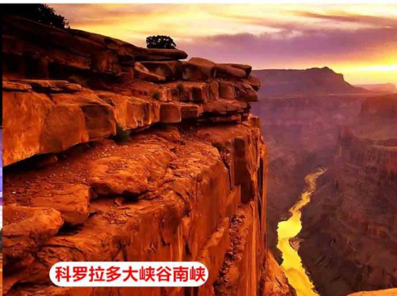
科罗拉多大峡谷南峡