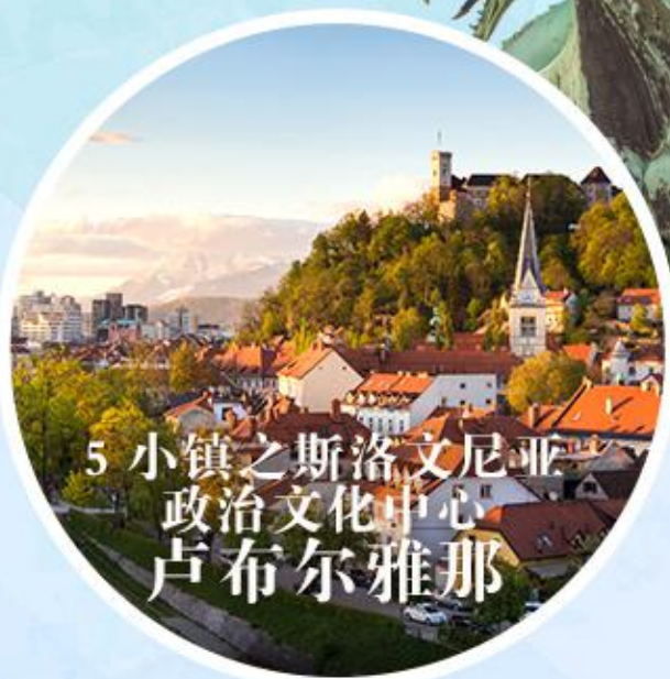
5 小镇之斯洛文尼亚 政治文化中心 卢布尔雅那