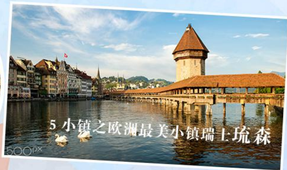
5 小镇之欧洲最美小镇瑞士琉森