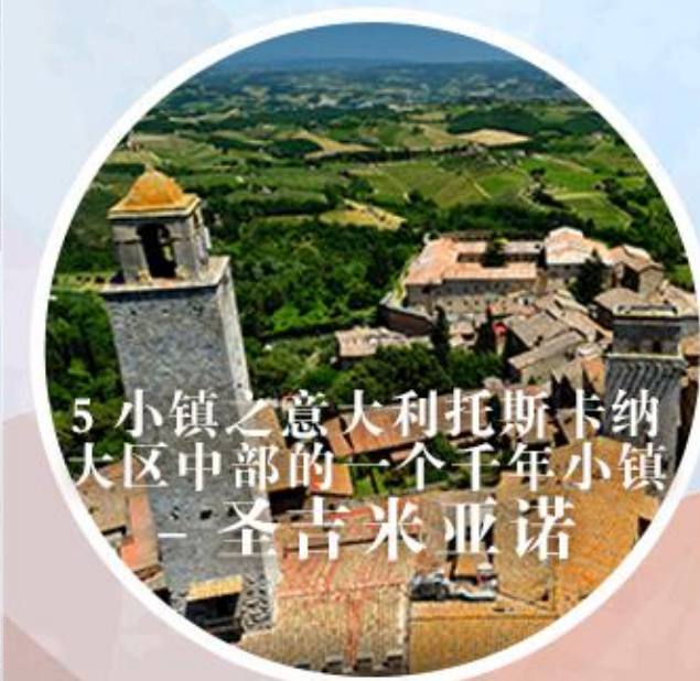
5 小镇之意大利托斯卡纳 大区中部的一个千年小镇 - 圣吉米尼亚诺