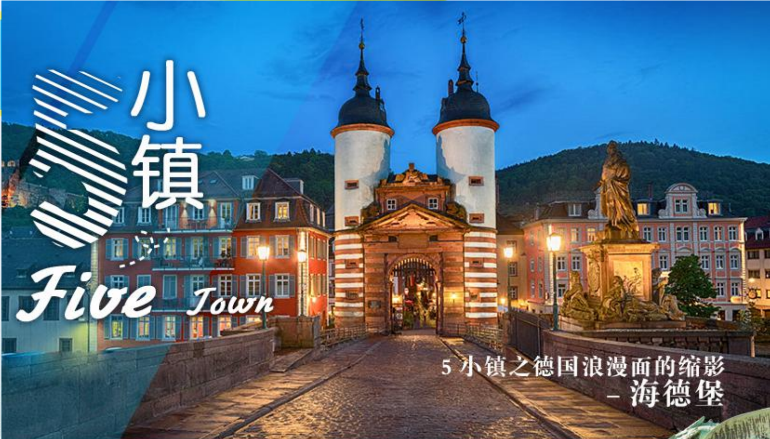
5 小镇之德国浪漫面的缩影 - 海德堡