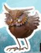
5 小镇之上帝散落人间的 积木小镇 - 根根巴赫