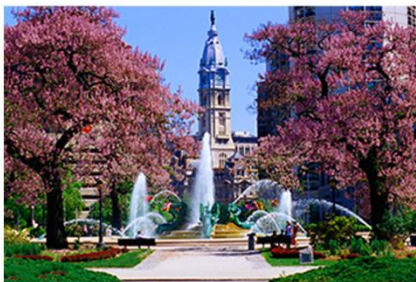
联合国宪章草签地 “费城”