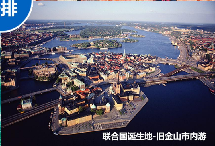
联合国诞生地-旧金山市内游