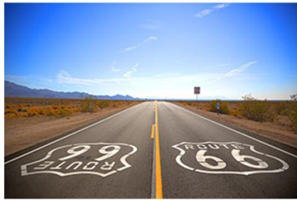
深度游览美国66号公路 感受牛仔风情