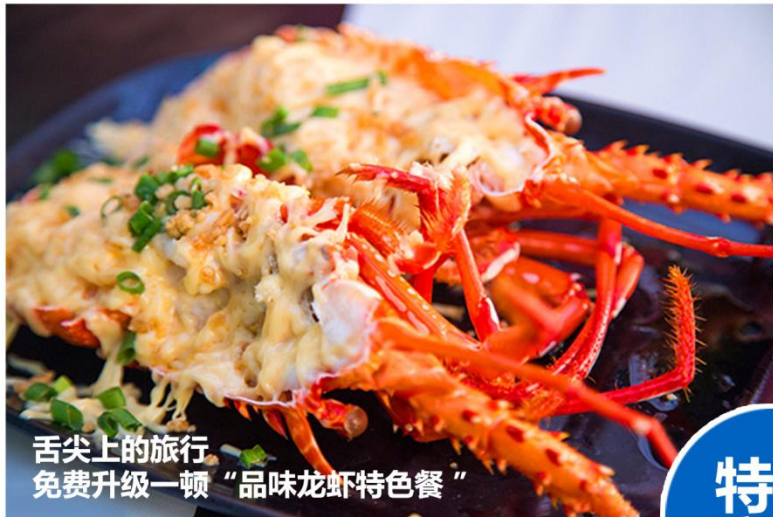
舌尖上的旅行 免费升级一顿“品味龙虾特色餐”