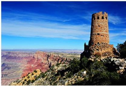
观“沙漠之塔” 走进印第安文化