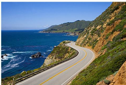
畅游加州 最美1号公路