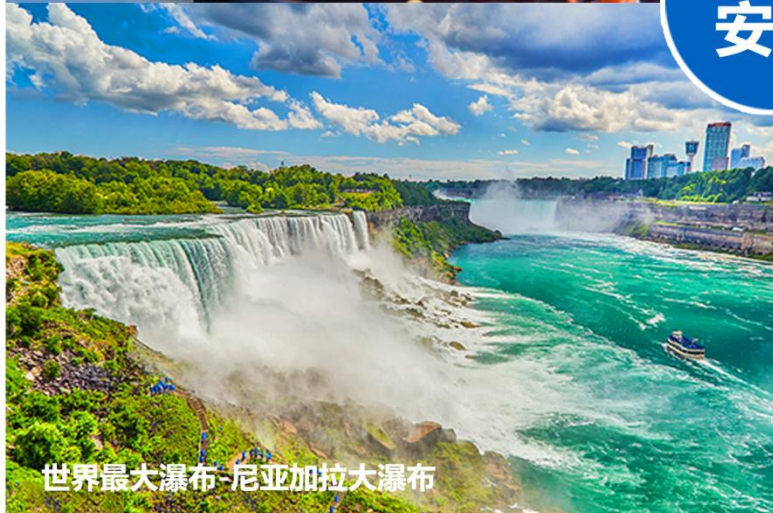
世界最大瀑布-尼亚加拉大瀑布