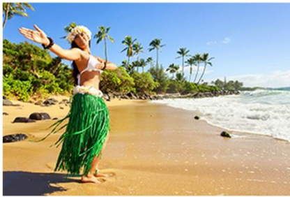
走进度假天堂 体验休闲夏威夷