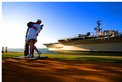
军港之城 “圣地亚哥”