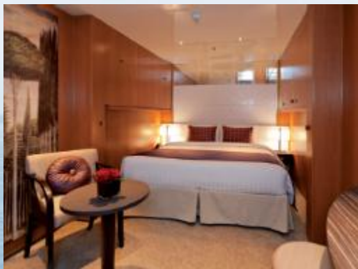
内舱 (CV/IC/IP/SI, 16.6平方)