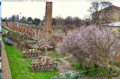
南斯拉夫历史博物馆（铁托墓）