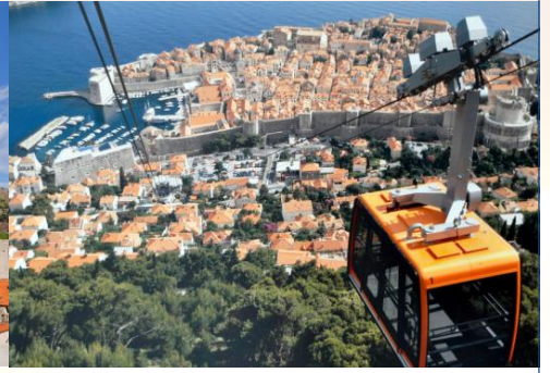
(杜布罗夫尼克缆车)