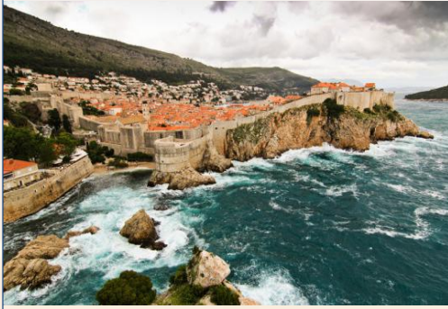
(杜布罗夫尼克老城墙)