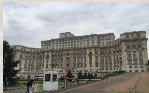
(布加勒斯特议会宫)