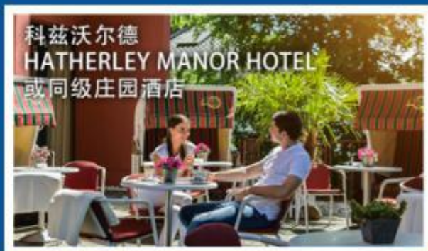
科兹沃尔德 HATHERLEY MANOR HOTEL 或同级庄园酒店