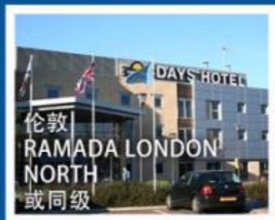
伦敦 RAMADA LONDON NORTH 或同级