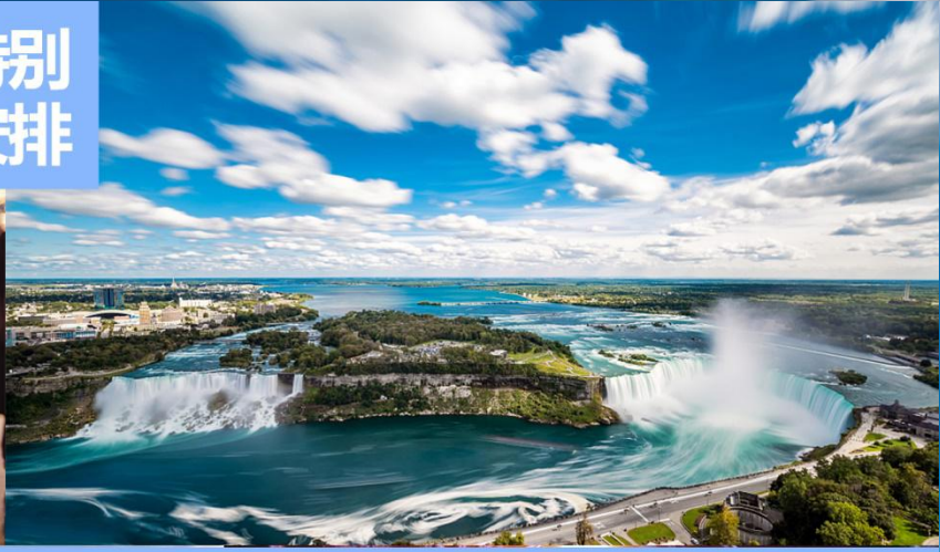
世界最大瀑布-尼亚加拉大瀑布